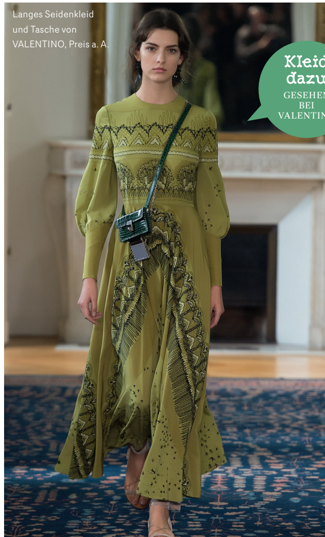
Langes Seidenkleid und Tasche von VALENTINO, Preis a. A.

Die Modefarbe des Jahres ist ein leuchtendes, HELLES GRÜN. Die Schmuck- und Uhrenwelt zieht nach. Hier setzt man aber lieber auf EDLES SMARAGD-GRÜN und «dunkle Tanne».