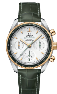
Uhr «Speedmaster» von OMEGA, Fr. 6150.-.